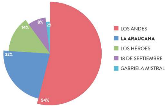
Gráfico N°2: Distribución de personas afiliadas por Caja de Compensación