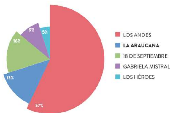
Gráfico N°1: Distribución de empresas afiliadas por Caja de Compensación